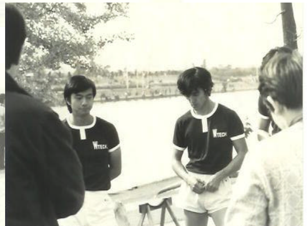
乗艇後のミーティング