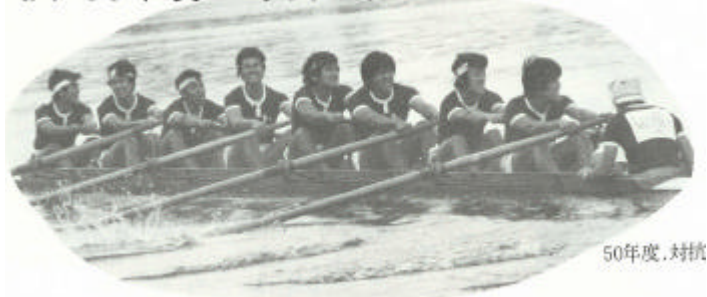
昭和50年 対校エイト 戸田レガッタ出漕