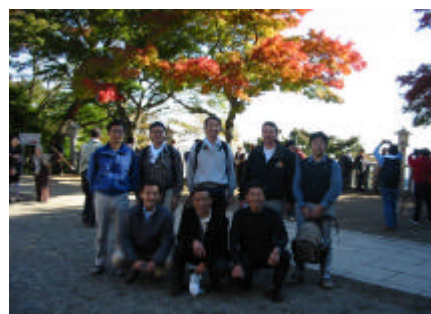
無事下社へ帰還、茶店の休憩を終