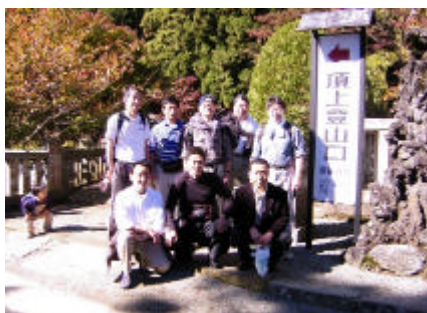
大山頂上登山口、いよいよ山登りへ