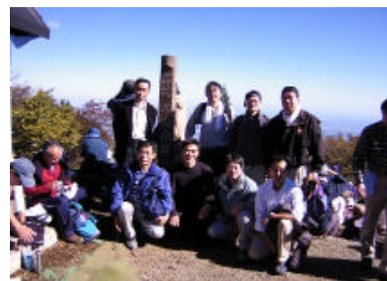
苦闘の末に大山制覇、山頂にて