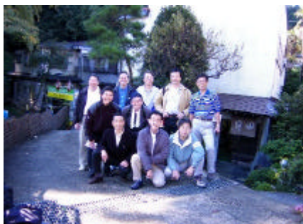
宴会の夜が明け田月旅館前にて