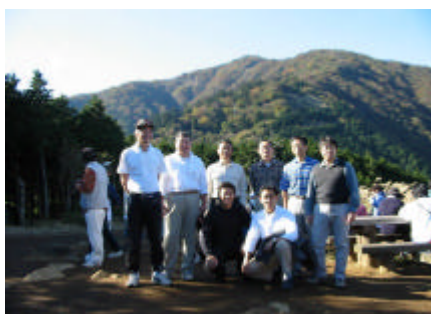
下山途中で一服中