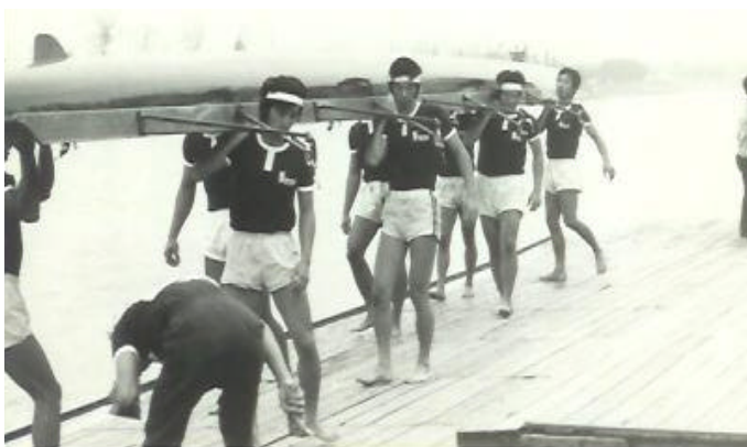
予選レース直後（早稲田大学艇庫前の船台にて）