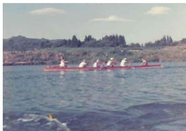
昭和50年夏 新人合宿(福島荻野)当時3年生