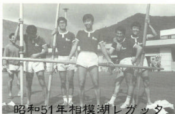
第20回相模湖レガッタ