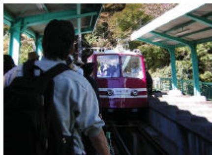
ケーブルカーにて大山中腹へ