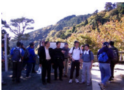
山登り前のひと時