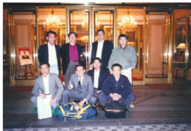
平成10年度 OB総会参上